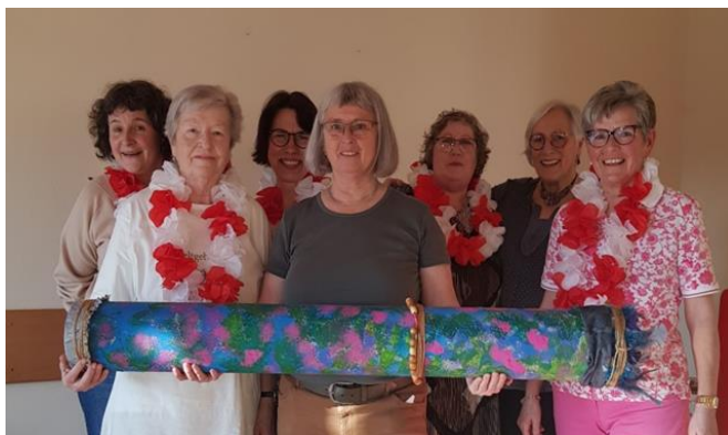
Vorbereitungsteam der Ökumene Asbach

Die 15 Cookinseln liegen im Südpazifik. Sie sind ca. 3000 km von Neuseeland entfernt. Das Vorbereitungsteam hat die Lebensweise der Frauen auf den Cookinseln interpretiert. Dieses Paradies mit ca. 15.000 Bewohnerinnen hat auch Schattenseiten. Angefangen bei einer bis heute nachwirkenden Missions- und Kolonialgeschichte bis hin zur aktuellen Bedrohung durch den Klimawandel mit Zyklonen und Überflutungen. Auch der Abbau von Bodenschätzen auf dem Meeresgrund sehen die Bewohner als sehr kritisch. Die häusliche und sexualisierte Gewalt ist ein großes gesellschaftliches Problem. Die vorgetragenen Texte wurden mit Liedern begleitet. Die Stimmung war ergriffen, von alledem was man erfuhr. Die Kollekte für die „Cookinseln „erbrachte 465,00 €. Im Anschluss daran tauschten sich die Frauen darüber aus, was sie zu diesem Thema erfahren haben, und verbrachten im Beisein von Pfarrer Dr. Bahne noch gemütliche Stunden bei Kaffee und Kuchen.